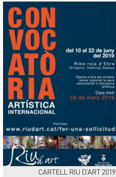
CARTELL RIU D'ART 2019.

Riu d'Art és una iniciativa organitzada per l'Ajuntament, amb l'Associació Cultural Riba Rocks, que parteix de l'art com a element transversal i dinamitzador proposant una estada de dues setmanes al poble per desenvolupar una obra, alhora que es coneixen i fan xarxa per fomentar projectes internacionals entre ells. L'organització els proporcionarà espais urbans on fer les intervencions. La convocatòria està oberta a totes les disciplines artístiques. Es valorarà la seva