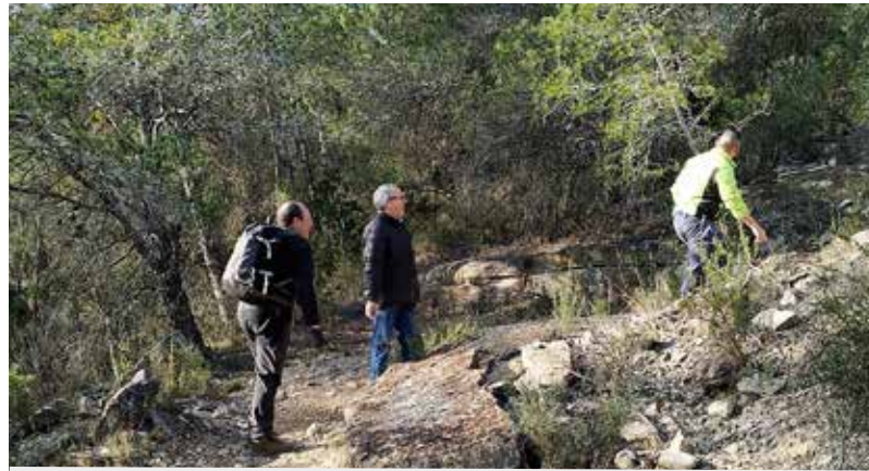
MEMBRES DE FIGOT TOUR I AMICS DE RIBA-ROJA HAN PARTICIPAT EN LA OBERTURA I RECUPERACIÓ DELS SENDERS DEL TERME MUNICIPAL.

Es tracta de la sendera dels Castellons, d'1,1 quilòmetres, que comunica la partida del mateix nom amb el camí de la Vall de les Savines. D'aquest punt, i fins al camí de Vall de Penes, s'han recuperat uns 500 metres d'un camí empedrat en temps inèdits. També s'han trobat 4,8 quilòmetres de la sendera dels Valencians, entre el camí de la Fatarella i la partida de Pinyeres, un recorregut que ha tingut molt èxit en les curses de BTT