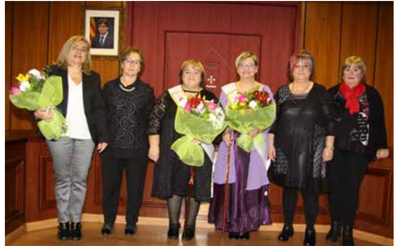
ALCALDESSA, REGIDORA I PREGONERA AMB L'ASSOCIACIÓ DE DONES.