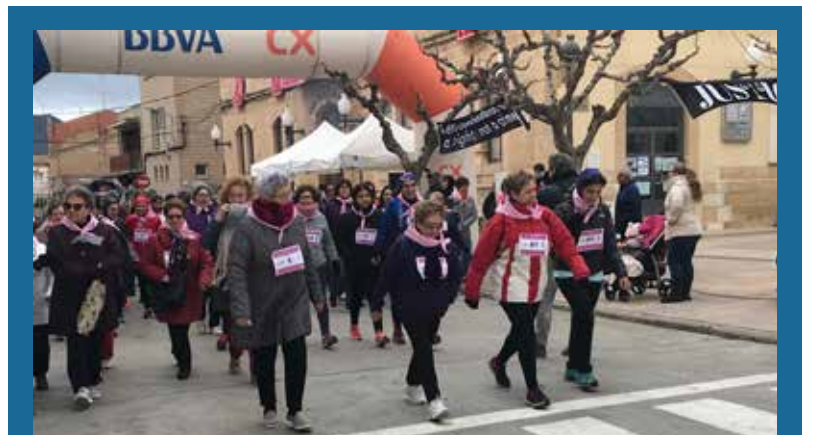
SORTIDA DEL GRUP QUE VA FER EL RECORREGUT CURT CAMINANT.