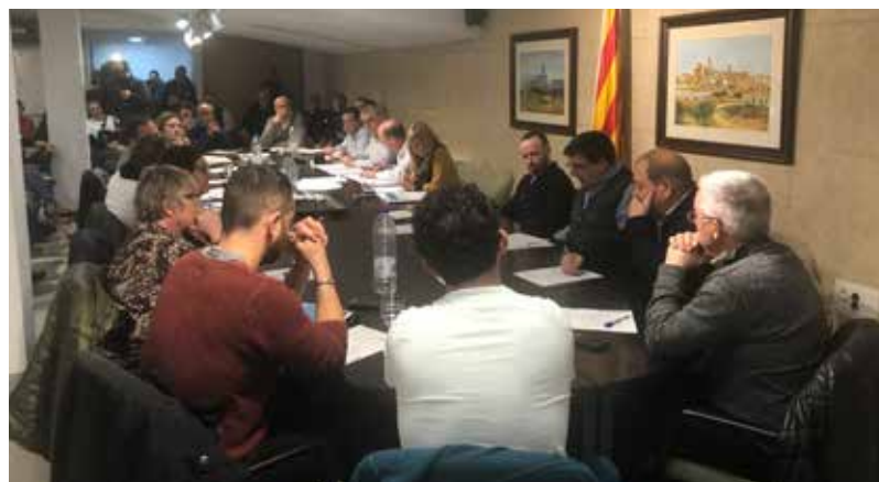
IMATGE DEL PLE DEL CONSELL COMARCAL DEL DIA 30 DE GENER.

La tramitació de la llicència d'obres del dipòsit de residus no perillosos i el centre de valorització de les Valls ha aixecat un moviment contrari a la comarca. El Ple del Consell Comarcal va aprovar el 30 de gener una moció de rebuig frontal, amb 13 vots a favor dels 18 assistents, per considerar-lo contrari a la línia de desenvolupament comarcal. Així es va exposar al conseller de Territori i Sostenibilitat, Damià Calvet, en una visita a Móra el 14 de febrer, a partir de la qual s'ha creat una comissió jurídica per estudiar si es pot paralitzar, ja que "no es pot fer una revisió d'ofici perquè ha superat tots els tràmits legals". El 2012 va obtenir el permís ambiental i el 2013, la llicència urbanística, sense que aquestes ni els tràmits municipals aixequessin fins ara oposició al territori. En aquests anys, Ajuntament i empresa han tingut en actiu un conveni de col·laboració amb prestacions per al