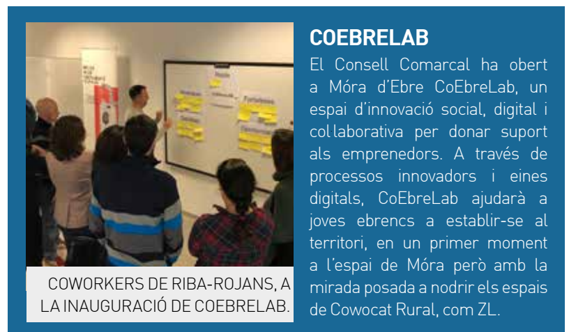
COWORKERS DE RIBA-ROJANS, A LA INAUGURACIÓ DE COEBRELAB.