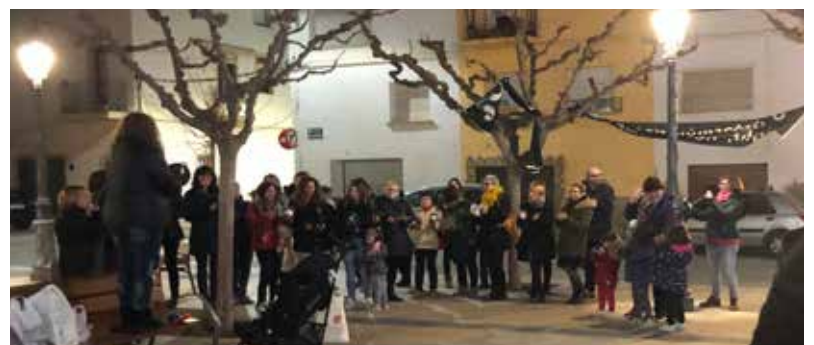
CASSOLADA FEMINISTA A LA PLAÇA DE LA VILA, ORGANITZADA EL 8 DE FEBRER PEL COL·LECTIU FEMINISTA DE RIBA-ROJA, UN MES ABANS DE LA VAGA DEL 8M PER REIVINDICAR LA IGUALTAT DE GÈNERE.

familiars, amics, membres de les associacions de dones de tots els pobles i representants del Consell i dels ajuntaments de la Ribera, a més de les dones homenatjades. A la trobada, anual i itinerant pels pobles, les dones de la Ribera són les protagonistes i cada any se'ls hi reconeix la seva trajectòria vital. L'acte l'organitza el Consell Consultiu de la Dona.