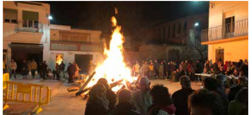
SANT ANTONI 2019 EL DISSABTE 19 DE GENER ES VA CELEBRAR LA TRADICIONAL FOGUERA DE SANT ANTONI A LA PLAÇA DEL REFOSSAR, ON ELS VEÏNS ES VAN REUNIR EN UN SOPAR POPULAR.

La regidoria de Protecció Civil ha redactat el Document Únic de Protecció Civil Municipal (DUPROCIM), una eina útil que avalua els riscos i que ha de servir per fer front a les emergències que es puguin donar al municipi, unificant el que fins ara estava en diversos plans de prevenció, com són el Pla de Protecció Civil de Catalunya (Procicat), el d'incendis forestals (Infocat), el d'aiguats i inundacions (Inuncat), el d'accidents en el transport de mercaderies perilloses (Transcat), el del sector químic (Plaseqcat) i el Pla d'Actuació Municipal davant Emergències Nuclears (PAMEN) integrat en el PENTA de la província, entre altres protocols locals.