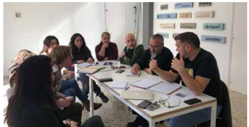
COWORKERS DE ZL, A LA SALA DE REUNIONS, FA UNS DIES ENRERE.

va obrir portes era l'únic espai d'aquestes característiques situat en un poble, el coworking s'estenia llavors a les grans ciutats, la qual cosa el va convertir en pioner i referent per a altres territoris rurals que busquen alternatives al seu desenvolupament. De fet, s'han succeït les visites d'arreu de Catalunya, de l'Estat i fins i tot d'Europa per conèixer el projecte i la història d'un espai que va quedar buit el 2012, quan la biblioteca es va traslladar a la planta baixa. Zona Líquida va cobrar vida perquè Riba-roja tenia un avantatge: tenia desplegada la fibra òptica i, amb el suport dels informàtics comarcals i els ajuts europeus del Centre d'Iniciatives Socioeconòmiques (CIS), també amb una riba-rojana al capdavant, el seu model s'ha expandit arreu del país, on avui hi ha una vintena d'espais que formen la xarxa Cowocat Rural.