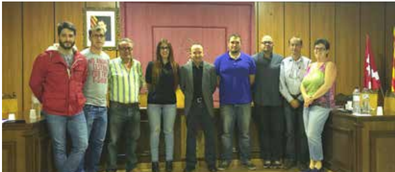
DEU VEÏNS HAN FORMAT LA CORPORACIÓ MUNICIPAL AQUEST 4 ANYS.