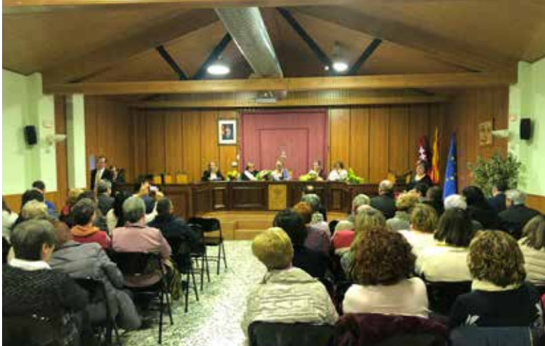
LA SALA DE PLENS VA ACOLLIR L'ACTE PROTAGONITZAT PER LES DONES.