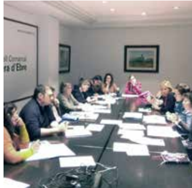
ES TREBALLA AMB ALTRES REGIDORS I ELS TÈCNICS COMARCALS DE JOVENTUT.

A més de als joves, des de la regidoria de Joventut també s'està