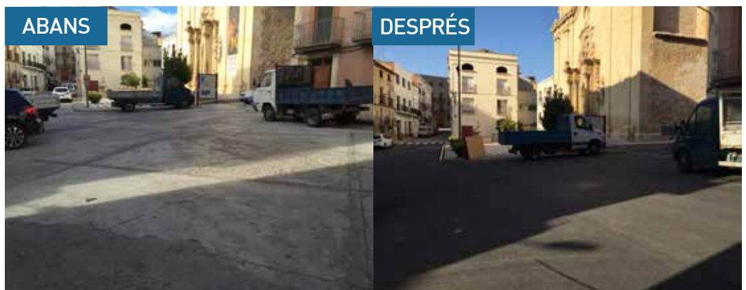
AMB LES OBRES REALITZADES HA QUEDAT RESTITUÏT EL FERM EN MAL ESTAT QUE HI HAVIA A L'ENTORN DE LA PLAÇA DE L'ESGLÉSIA.