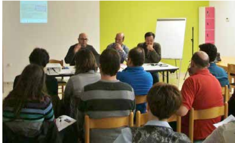
XERRADA QUE ES VA FER EL MES D'OCTUBRE PASSAT SOBRE LES OPORTUNITATS DE FUTUR PER AL COMERÇ LOCAL.

i crear ocupació. La diagnosi inicial (feta a partir de 174 enquestes a ciutadans, 84 botiguers, els presidents d'associacions locals i 18 representants públics) destaca, a pesar de la regressió que ha patit el sector, aspectes positius per treballar els pròxims anys, sobre tot el potencial de creixement lligat al sector turístic i la bona valoració