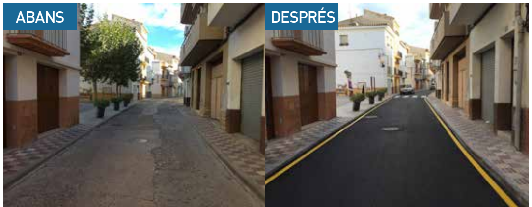
LA IMATGE DEL CARRER MAJOR, EN EL SEU TRAM CENTRAL, ÉS UNA MOSTRA DEL CANVI QUE HA PATIT LA VIA EN LES DARRERES SETMANES.

La meitat del cost de la pavimentació d'aquests carrers, 21.342,52 euros, prové del crèdit a llarg termini de 200.000 euros que l'Ajuntament va signar a finals d'octubre amb el BBVA. Aquests diners es destinaran íntegrament a finançar inversions per al municipi. Així, a més de la pavimentació dels carrers ja executats, es contempla el finançament del projecte d'arranjament del carrer Sequer, que després d'anys de demanda veïnal està a punt de començar, i que preveu una inversió 159.711,97 euros, incloent-hi també la millora de la plaça del Forn. Serà la primera intervenció de millora urbanística al Nucli Antic del poble.