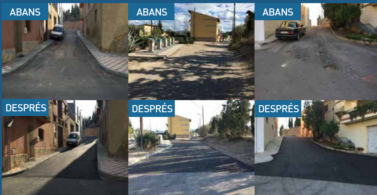
TAMBÉ S'HA EXECUTAT LA PAVIMENTACIÓ DEL TRAM NORD DEL CARRER DE LA PAU (A L'ESQUERRA), EL CARRER PROGRÉS (AL CENTRE) I EL TRAM DEL CARRER XIPRER QUE DÓNA ACCÉS AL CALVARI (A LA DRETA).

Juntament amb l'adjudicació del projecte de millora dels carrers Major i entorn de l'Església, l'Ajuntament va negociar amb l'empresa adjudicatària de les obres millores en altres tres trams de via urbana del poble.